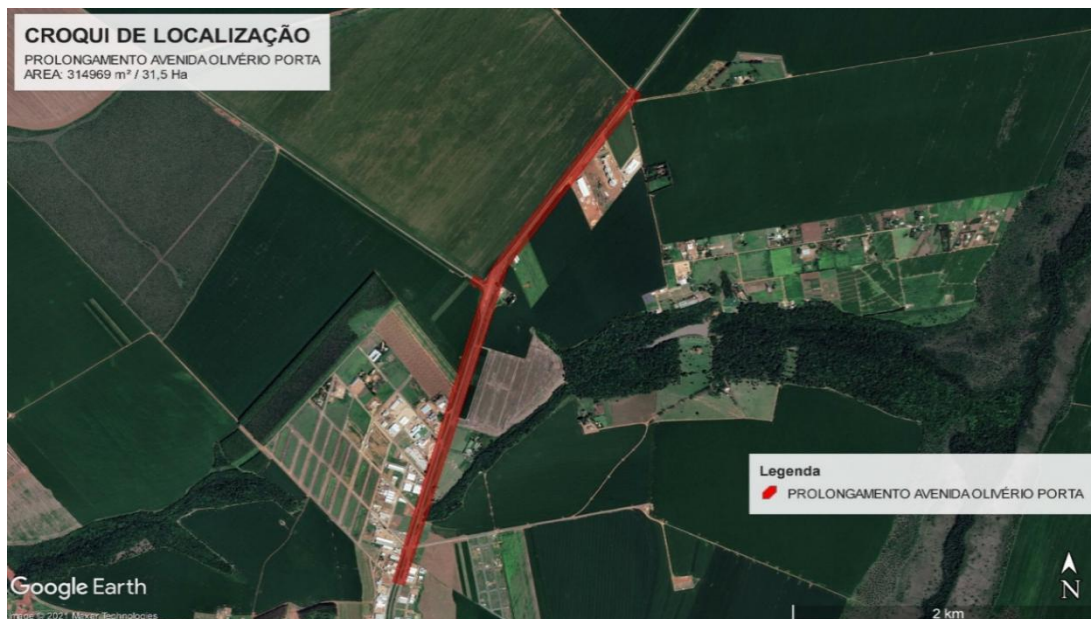
Imagem 01 – Área de Interesse (Prolongamento da Avenida Olivério Porta).