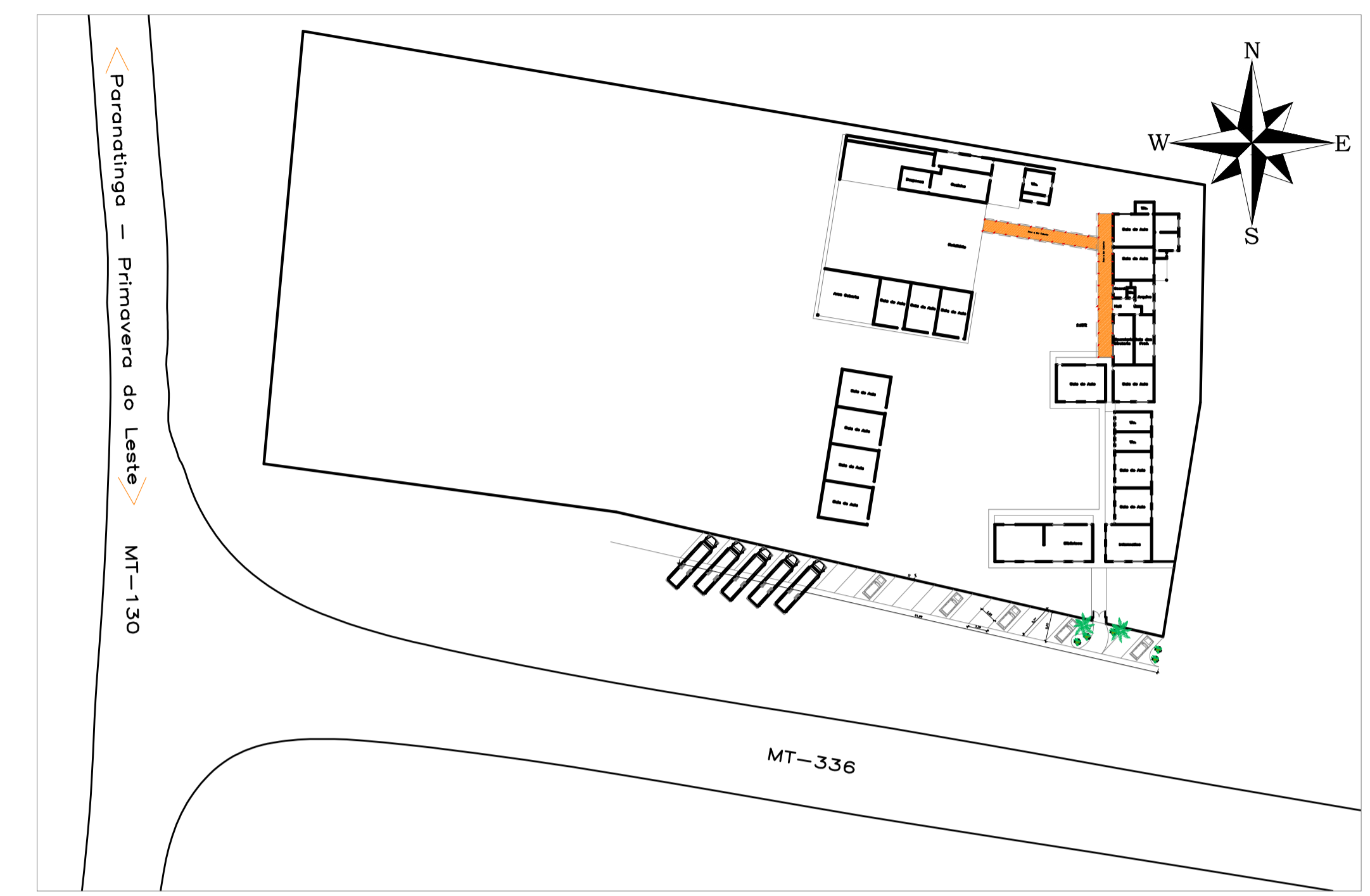
Localização Escala: 1/800