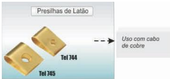
PRESILHAS DE LATÃO