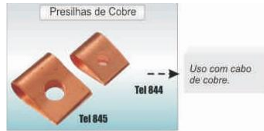
PRESILHAS DE COBRE