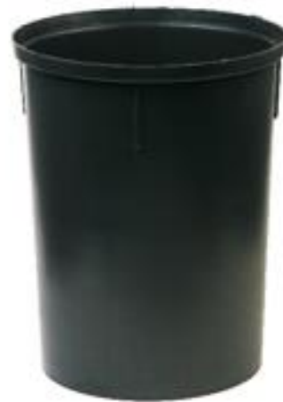
CAIXA DE INSPEÇÃO