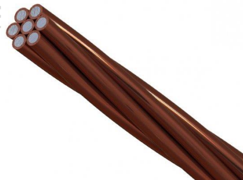
CABO DE AÇO COBREADO