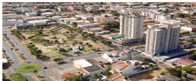
Imagem aérea da região central de Primavera do Leste

Primavera do Leste era chamada de Bela Vista das Placas, Rodovia 070, Km 150, Entroncamento Paranatinga. A Fundação e implantação do projeto Cidade de Primavera ocorreu no dia 26 de setembro de 1979, projetada pela Construtora e Imobiliária Consentino.