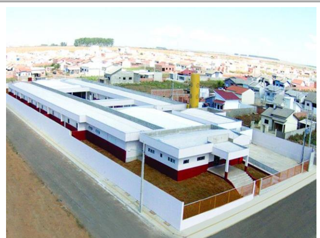
EMEI Rosidelma Almeida é uma das maiores e mais modernas de Mato Grosso